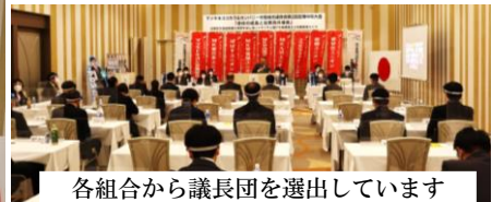
各組合から議長団を選出しています