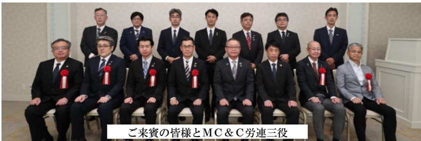
ご来賓の皆様とMC & C 労連三役