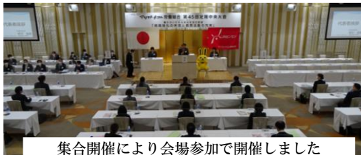
集合開催により会場参加で開催しました