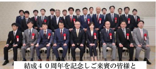
結成40周年を記念しご来賓の皆様と