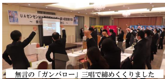
無言の「ガンパロー」三唱で締めくくりました