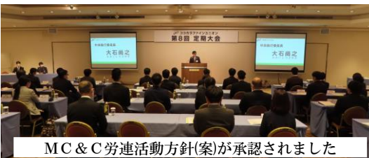
MC & C 労連活動方針(案)が承認されました