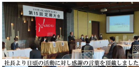
社長より日頃の活動に対し感謝の言葉を頂戴しました