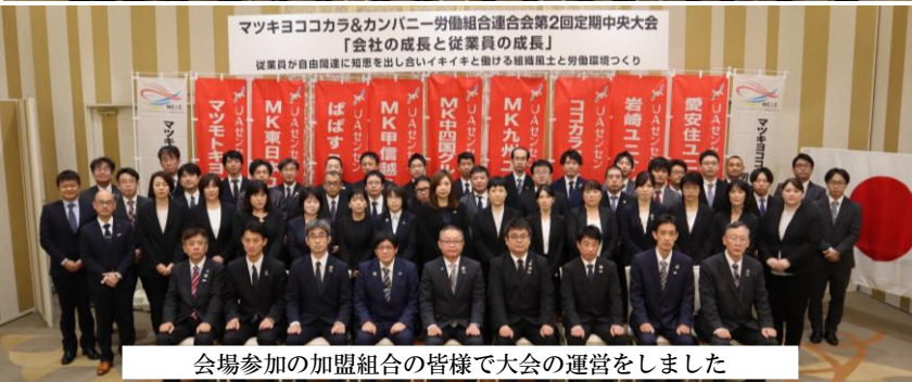
会場参加の加盟組合の皆様で大会の運営をしました