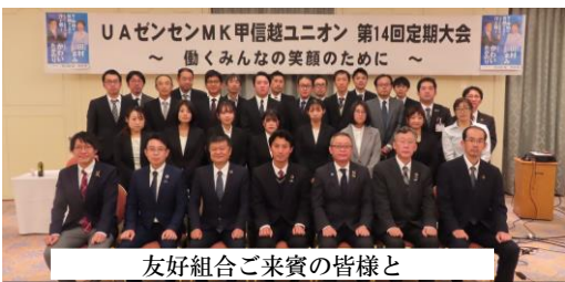
友好組合ご来賓の皆様と

大会報告・議案 2022年度報告／①一般活動報告 ②会計報告 ③会計監査報告 2023年度議案／第1号議案：組合規約改定 第2号議案：役員の補充 第3号議案：活動計画 第4号議案：予算 第5号議案：総合労働条件闘争及び一時金要求 第6号議案：第20回統一地方選挙必勝決議