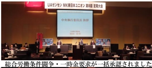
総合労働条件闘争・一時金要求が一括承認されました