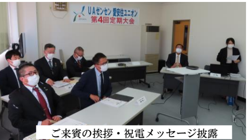
ご来賓の挨拶・祝電メッセージ披露