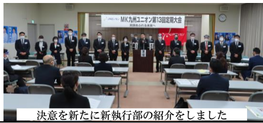
決意を新たに新執行部の紹介をしました