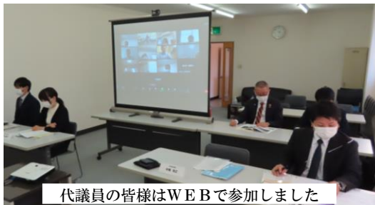
代議員の皆様はWEBで参加しました