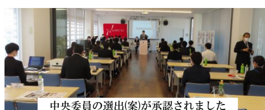
中央委員の選出(案)が承認されました